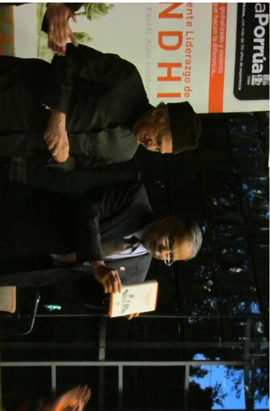
El Embajador Jain presentando la Edición en Español de 'El Sobresaliente Liderazgo de Gandhi, el 25 de Abril