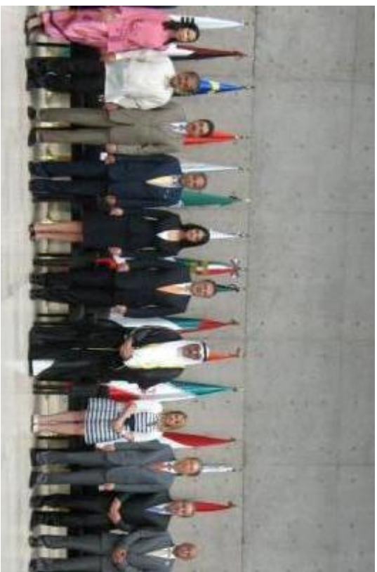
Embajadores de países Asiáticos participando en el Festival Cultural Asiático con el Jefe de Gob. Marcelo Ebrard, Abril 26